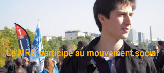
Le MRC participe au mouvement social

Bulletin d'information du Mouvement Républicain et Citoyen - Novembre 2010 - No : 13