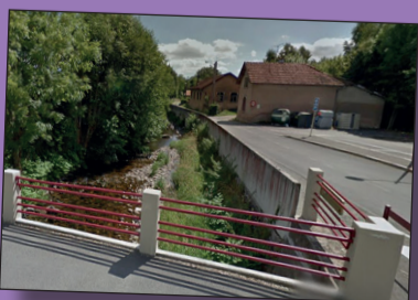
La Savoureuse à Giromagny (avenue de Schwabmunchen)

Incompétence ou malhonnêteté ? C'est la question que pose la prétention de Damien Meslot de renaturaliser en plein cœur de Belfort moins de deux kilomètres d'une rivière de 41,2 km qui est un torrent de montagne sur les premiers kilomètres de son parcours. De Lepuix-Gy à Valdoie, elle a fait l'objet de tant d'aménagements et de rectifications, d'abord pour utiliser la force motrice de son flot dans les usines construites tout au long de son parcours, ensuite pour protéger les villages et les bourgs suscités par cette industrialisation, qu'elle a perdu en deux siècles 9 % de sa longueur. Une étude faite en 2005 par les services du Conseil départemental a montré que plus de 80 % du lit majeur a été urbanisé ou déconnecté du lit mineur par des remblaiements ou des aménagements divers. La prétention de Damien Meslot coûtera très cher aux belfortains en aménagements supplémentaires pour obtenir les autorisations que son projet nécessite !