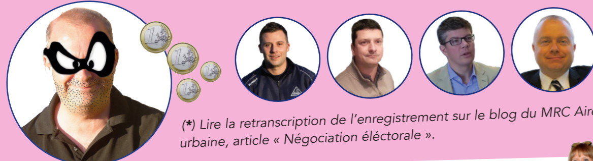
(*) Lire la retranscription de l'enregistrement sur le blog du MRC Aire urbaine, article « Négociation électorale ».