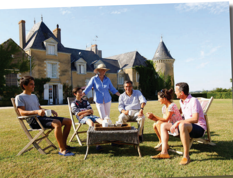
François Fillon ne connaît pas la crise... immobilière. La petite entreprise familiale dans son Manoir de Beaucé (photo sans trucage ©Paris-Match)

Pour tous les autres, les plus modestes, les artisans et les commerçants, les familles, les salariés et les retraités, il faudra se serrer la ceinture.