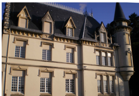
CHÂTEAU DE LEGUILLON, VESCEMONT

La session de l'université permanente aura lieu à proximité directe de Belfort, dans un cadre agréable et champêtre, sur les contreforts du massif vosgien.